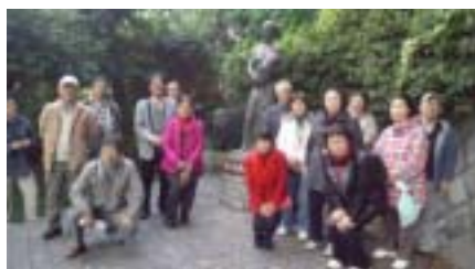
【「平和の母子像」前で】

第二の基地県である神奈川の旅でした。神奈川の米軍基地の面積は20.8km 2 だが、基地数は14で、沖縄の34に次ぐ。横須賀海軍施設に海軍司令部、キャンプ座間に陸軍司令部があり、有事の際には海軍・陸軍の司令基地になる。